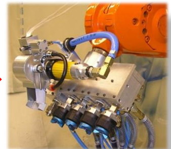
ゲルコートガン × 4 チョッパーガン × 1