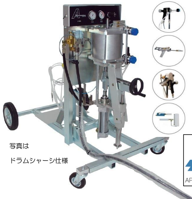
写真は ドラムシャーシ仕様